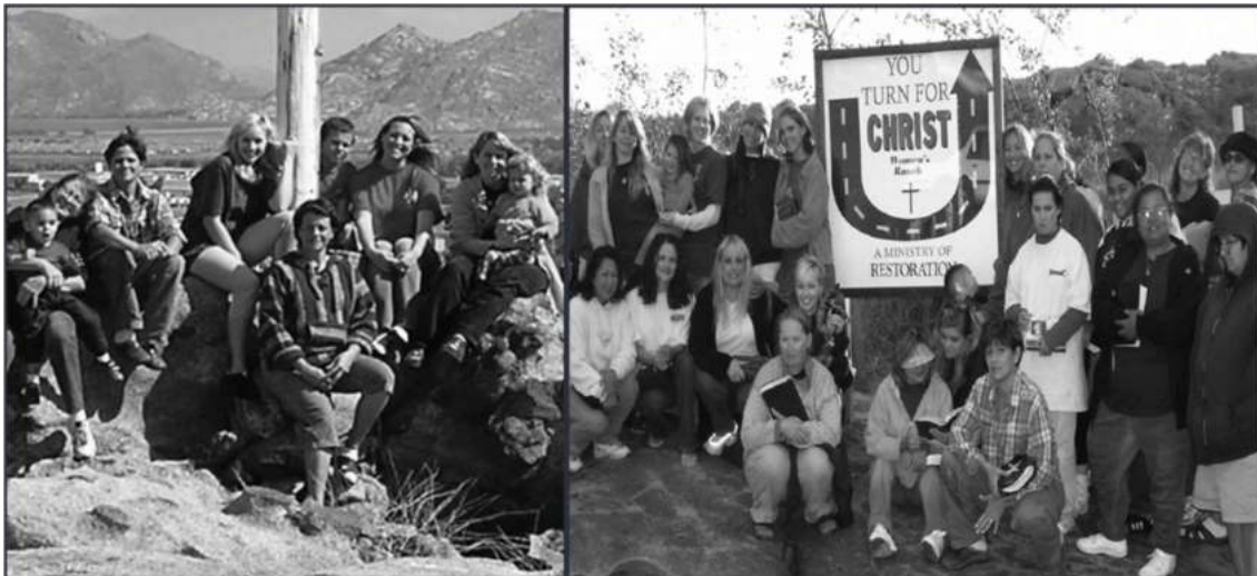
Le ranch des femmes de U-Turn for Christ dans les débuts et aujourd'hui