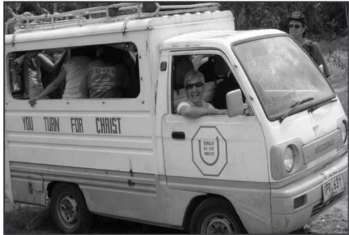
Maman pendant notre voyage missionnaire aux Philippines

Je me souviens de tout le travail que ma mère faisait quand nous étions jeunes. Elle a fait de nombreux sacrifices pour nous. Mais ce qui m'a le plus impressionné c'était la paisible dignité avec laquelle elle gérait sa vie. Je ne me souviens pas qu'elle ait jamais eu une journée de fou ou pris une journée pour se prélasser, même si je suis sûr qu'elle en a eu. Ce dont je me souviens c'est avec quel amour elle a pris soin de notre famille, tous les jours, sans jamais se plaindre.