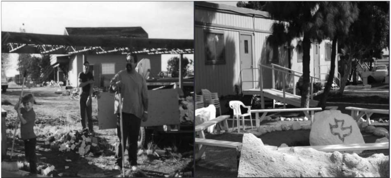
Le ranch de U-Turn for Christ dans les débuts et aujourd'hui