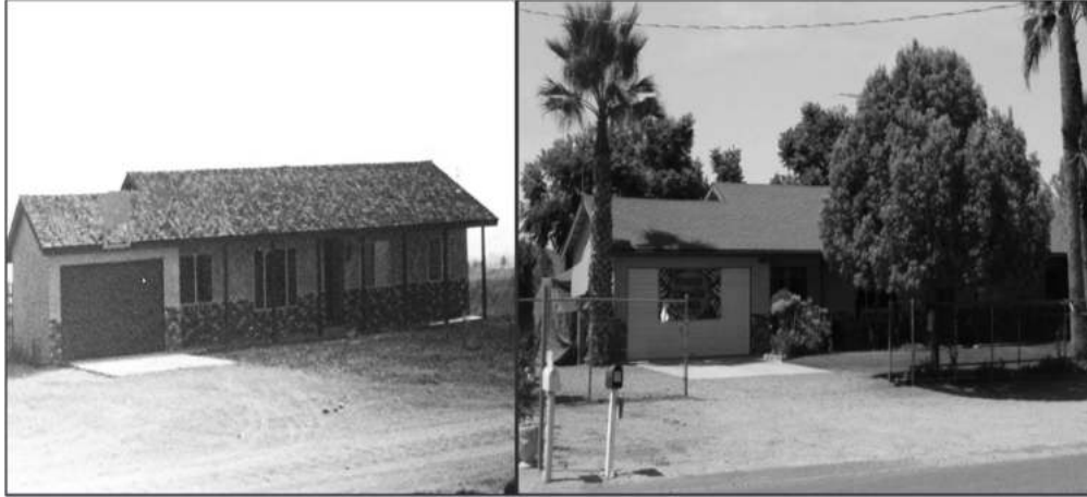
La maison des Brown avant et après la restauration